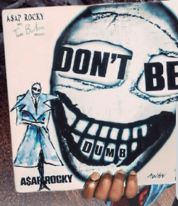
A$AP Rocky Con varias portadas diseñadas por el cineasta Tim Burton, con un estilo entre gótico y urbano, llega su cuarto material discográfico.