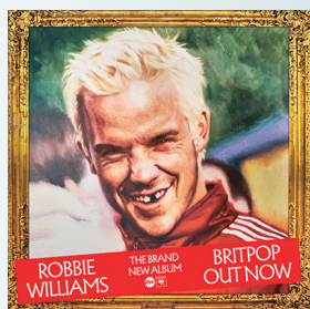
Robbie Williams El músico regresa con este álbum desde The Christmas Present , en 2019.

El 2026 se perfila como un año crucial para la industria musical. Tras giras multitudinarias, silencios creativos y pistas dejadas en entrevistas y redes sociales, algunos de los artistas más influyentes del mundo preparan sus lanzamientos. Sus discos generan expectativa no solo por sus nombres, sino por el impacto cultural que podrían tener.