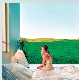
Hilary Duff Once años luego de Luck...ar Something estrenará sus nuevas canciones.